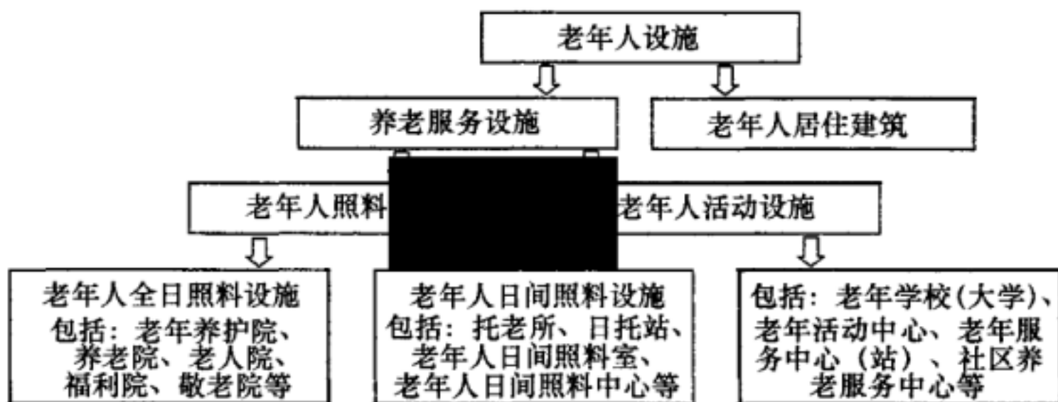
图 1 老年人照料设施的定位

以 20 床（人）作为设计总床位数（老年人总数）的下限值，是兼顾经济性、技术性及其设施能力等因素，为适用于本标准的老年人照料设施建筑设计给出适宜的规模范围。在后续运营中，老年人照料设施的实际总床位数（老年人总数）不应超过设计总床位数（老年人总数）。给出设计总床位数（老年人总数）下限值，也明确了设计总床位数小于或等于 19 床的老年人全日照料设施，以及设计老年人总数小于或等于 19 人的老年人日间照料设施的建筑设计可不按本标准执行。