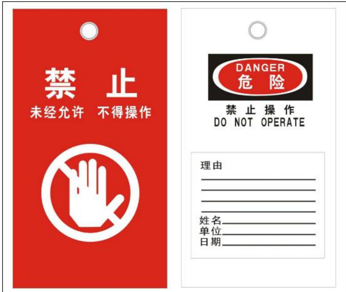
图A.1 “危险！禁止操作”标签样式示例（正反面）