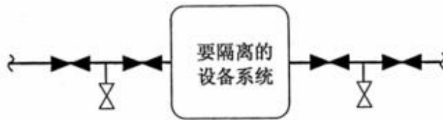
图 C.2 双阀加排空隔离