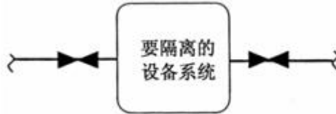
图 C.1 单阀隔离