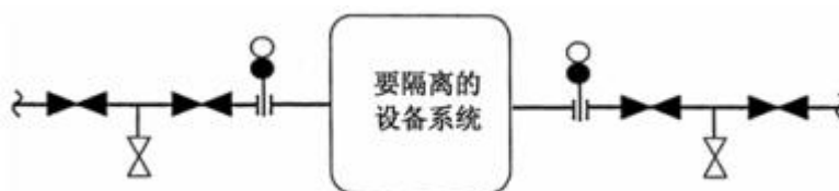
图 C.4 双阀加盲板隔离

双阀加盲板隔离是组合使用双隔断及放空，并插入盲板法兰，关闭管线上进出的两个控制阀，并放卸两阀之间的介质，以便插入盲板法兰从而实现绝对隔离，在隔离的过程中应选用适当规格的盲板法兰，连接密闭容器的所有排放口必须完全切断并用盲板法兰封闭开口端。双阀加盲板隔离见图 C.4。