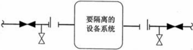
图 C.5 管线拆卸隔离