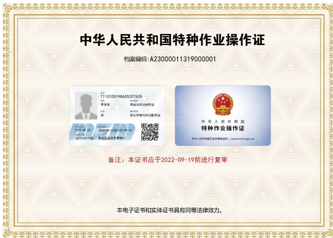
图 A1 特种作业操作证电子证照样式示意图