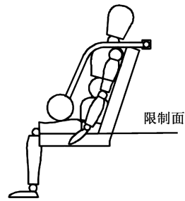
图 3 压腿型压杠限制面