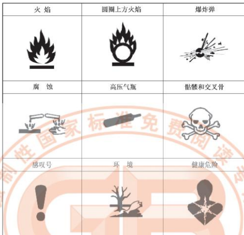
图 1 GHS 中应当使用的标准符号