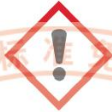
图 3 皮肤刺激物象形图