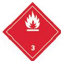
图 2 《联合国规章范本》中易燃液体的象形图

5.1.4.2.2 对于运输,应当使用规章范本规定的象形图(在运输条例中通常称为标签)。规章范本规定了运输象形图的规格,包括颜色、符号、尺寸、背景对比度、补充安全信息(如危险种类)和一般格式等。运输象形图的规定尺寸至少为 100 mm×100 mm,但非常小的包装和高压气瓶可以例外,使用较小的象形图。运输象形图包括标签上半部的符号。规章范本要求将运输象形图印刷或附在背景有色差的包装上。以下例子是按照规章范本制作的典型标签,用来标识易燃液体危险,见图 2。